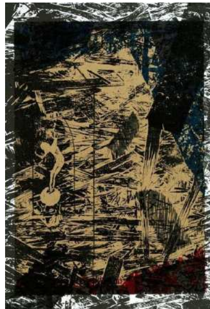
Saltimbanque 2007, Bois gravé et découpé, 50 x 33 cm.

Madame Pelletier est inspirée par la nature, l'architecture et l'histoire de l'art, la nature morte et le paysage. Elle se préoccupe de l'environnement et récupère souvent des matériaux trouvés ou des parties de matrice pour créer de nouvelles œuvres d'art.